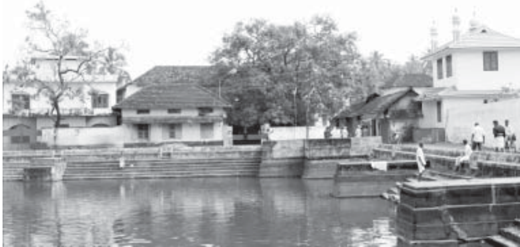
മൗളനത്തൂർ ഇസ്ലാം സഭ

1871-നും 1881-നും ഇടയിൽ മലബാറിലെ മുസ്ലിം ജനസംഖ്യയിൽ ഉണ്ടായ വർധന സംബന്ധിച്ച് പ്രസിഡൻസി കാന്റോണറി (1881) റിപ്പോർട്ടിൽ ഖണ്ഡിക 151-ൽ ഇങ്ങനെ കാണുന്നു: അധമ സ്ഥിതിയും അപമാനകരമായ അവശതയും ഏറ്റവും പ്രകടമായി അനുഭവിക്കുന്ന ഒരു വിഭാഗമാണ് ചെറുമർ. 1871-ലെ കാന്റോണറിയിൽ മലബാറിൽ അവരുടെ ജനസംഖ്യ 99,009 ആയിരുന്നത് പത്തു വർഷം കഴിഞ്ഞപ്പോൾ 1881-ലെ കണക്കിൽ 64,725 ആയി ചുരുങ്ങി. ജില്ലയിൽ പൊതുവെ ഈ കാലയളവിൽ ഉണ്ടായ ജനസംഖ്യാവർധന 5.71 ശതമാനമായിരുന്നു. ചെറുമരെ സംബന്ധിച്ചിടത്തോളം ഇതേ കാലയളവിൽ ജനസംഖ്യ 34.63 ശതമാനം കണ്ട് ചുരുങ്ങുകയാണുണ്ടായത്. മറ്റു വിഭാഗക്കാരുടെ അനുപാതമനുസരിച്ച് 1881-ൽ 40,000 ചെറുമർ കൂടുതൽ ഉണ്ടാവേണ്ടതായിരുന്നു. അത്രയും പേർ ഇല്ലാതായെന്നു സാരം. ഇസ്ലാംമതത്തിലേക്കുള്ള കൂട്ടംകൂട്ടമായ പരിവർത്തനമാണ് ഇതിനു പിന്നിലുള്ള കാരണം. ഒ