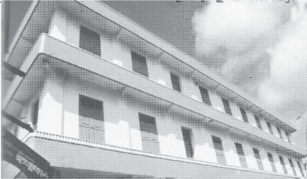
സഭയുടെ പ്രധാന കെട്ടിടം