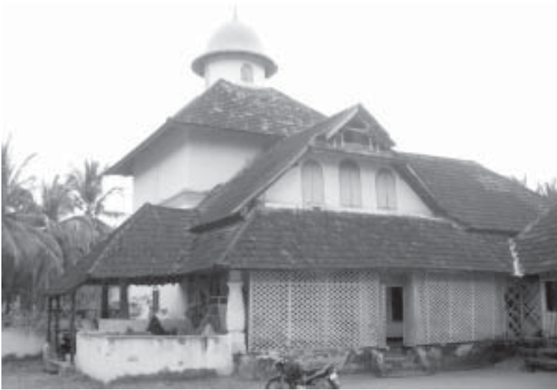
പൊന്നാനി വലിയ ജാറം

ഇന്ത്യയിലേക്ക് ചെങ്കടൽ മാർഗത്തിലൂടെയുള്ള കടൽവ്യാപാരം മദ്ധ്യകാലം വരെ മുസ്ലിംകളുടെ കൃത്യമായ കയ്യാളിയിരുന്നു. ഇത് തകർക്കുന്നതിന് പതിനഞ്ചാം നൂറ്റാണ്ടിന്റെ ആദ്യം മുതൽ പറങ്കികൾ ശ്രമമാരംഭിച്ചു. വാസ്കോഡിഗാമ കാപ്പാട് കപ്പലിറങ്ങിയതോടെ അതുവരെ കേരളത്തിലുണ്ടായിരുന്ന വിദേശവ്യാപാര ബന്ധങ്ങളിലെല്ലാം കാതലായ വ്യതിയാനം വരാൻ തുടങ്ങി.