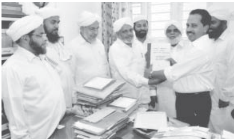
മലപ്പുറം ജില്ലയെ സമ്പൂർണ്ണ ലഹരിവിമുക്ത ജില്ലയായി പ്രഖ്യാപിക്കണമെന്നാവശ്യപ്പെട്ട് സുന്നി യുവജനസംഘം നേതാക്കൾ കലക്ടർക്ക് നിവേദനം നൽകുന്നു

സമാധാനജീവിതം താറുമാറാക്കുന്നതിനും കുടുംബാന്തരീക്ഷം തകർക്കു