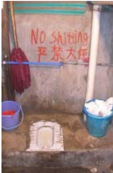
ചികിത്സാഘട്ടങ്ങൾക്ക് ഇവരെ വിധേയരാക്കേണ്ടിവരും.

ട്രെയ്നുകളിലെ ടോയ്ലെറ്റുകളാണെങ്കിൽ ഇത് ഒന്നുകൂടി ആകർഷകമായി അവതരിപ്പിച്ചിട്ടുണ്ടാവും. ഭാഗങ്ങൾ അടയാളപ്പെടുത്തി അതിന്റെ ധർമ്മങ്ങൾ കൂടി എഴുതിവെച്ചിട്ടുണ്ടാവും. ചില ഭാഗങ്ങൾക്ക് നാം കേൾക്കാത്ത പേരുകൾ നൽകി പരിചയപ്പെടുത്തും. വായനക്കാരുടെ പദസമ്പത്ത് വർദ്ധിപ്പിക്കാൻ ഇത്തരം രചനകൾ പ്രയോജനപ്പെടും. മിക്കവാറും രചനകളുടെ കൂടെ ഫോൺ നമ്പറും ഉണ്ടാവും. വിളിച്ചാൽ സംശയം ദൂരീകരിക്കാമെന്നു മാത്രമല്ല, പ്രായോഗിക പരിജ്ഞാനത്തിനും അവസരം ലഭിക്കും.