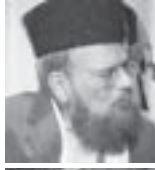
ജസ്റ്റിസ് മുഹമ്മദ് തഖി ഉസ്മാനിയുടെ കുറിപ്പുകൾ - പത്ത്

എന്തുതന്നെയായാലും ഈ ചെറുവിഭാഗങ്ങൾ ഇസ്ലാമിക ലോകത്ത് ചില ഭാഗങ്ങളിൽ കേന്ദ്രീകരിക്കുകയും ഇസ്ലാമിക സമൂഹത്തിനുള്ളിൽ നിലനിൽക്കുന്ന വൈവിധ്യങ്ങൾക്ക് അവരുടേതായ സംഭാവനകൾ നൽകുകയും ചെയ്തിട്ടുണ്ട്. അത് പലതും പ്രതികൂലതലത്തിൽനിന്നു കൊണ്ടായിരുന്നെങ്കിൽ പോലും ഒപ്പം വ്യത്യസ്ത ചിന്താധാരകൾ വെച്ചു പുലർത്തുന്നവരുടെ അധ്യാപനങ്ങൾ ഇസ്ലാമിലെ ഭൂരിപക്ഷ സമൂഹത്തോട് പല വിഷയങ്ങളിലും എതിരു നിൽക്കുന്നവയാണ്.