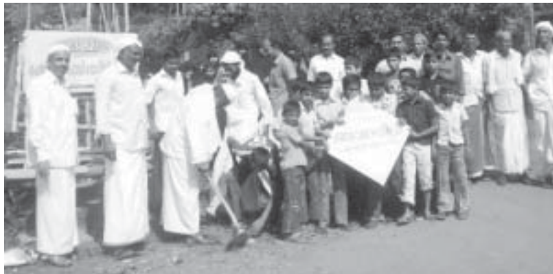
മദ്ദറസകളിലെ സേവനവാരത്തോടനുബന്ധിച്ച് വയനാട് ജില്ലയിലെ പിണങ്ങോട് എം.എച്ച്. നഗർ സിറാജുൽ ഇസ്ലാം മദ്ദറസ വിദ്യാർത്ഥികൾ ശുചീകരണം നടത്തുന്നു